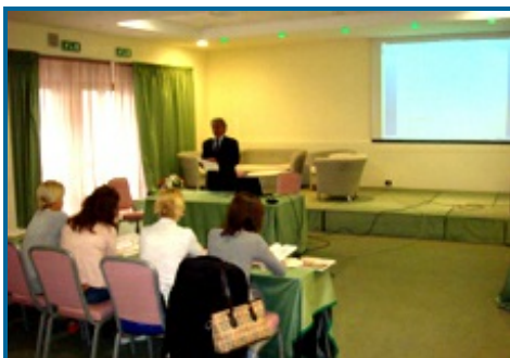
Il corso di lingua italiana presso il Park Hotel San Michele di Martina Franca

Nel 2010 l'Istituto "A. Pacinotti" di Taranto è diventato sede degli esami di certificazione internazionale della lingua italiana CELI, organizzati in collaborazione con l'Università per Stranieri di Perugia. La prima sessione di esame si è svolta il 7 giugno.